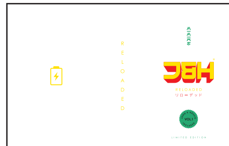
Beispiel einer Druckvorlage mit freistehenden Elementen

Beim Aufdruck auf die schwarze Fanbox haben Sie optional die Möglichkeit auch mit der Farbe Weiss zu arbeiten. Wenn Sie bestimmte Elemente gerne in Weiss drucken wollen, legen Sie einfach eine 5. Farbe (z.B. Pantone) als Vollton an (=100% einer Farbe), die wir im Druck als Weiss drucken können. Der Kontrast von Weiss auf schwarzer Box wirkt besonders edel, da dies bei normalen Druckverfahren (z.B. Papier) nicht möglich ist. Siehe Beispiel-Motiv rechts (Pantone Grün wurde als Weiss gedruckt -->